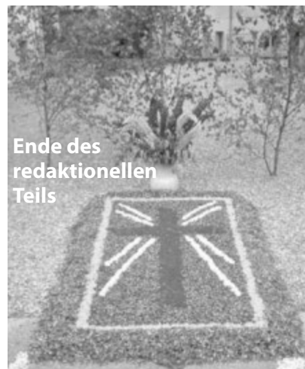
Ende des redaktionellen Teils