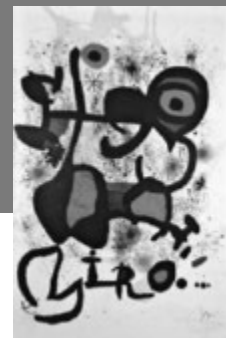
Joan Miró, Ausstellungsplakat Zürich, 1972